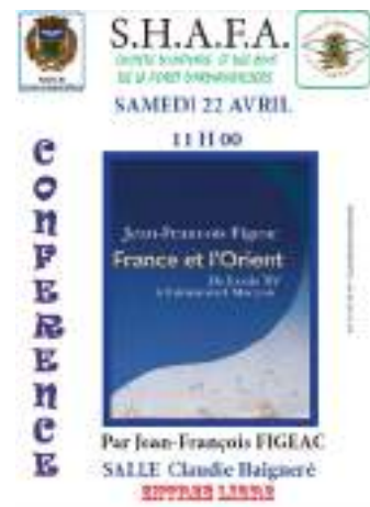
CONFÉRENCE DE LA SHAFa 22 Avril 2023 - à 11H00 en Salle Claudie Haigneré - Mairie Annexe