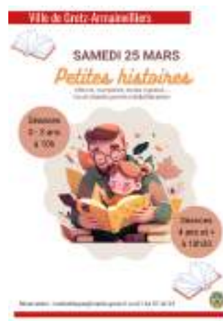
PETITES HISTOIRES 25 Mars 2023 - à 10h et 10h30 à la Médiathèque - SUR RÉSERVATION