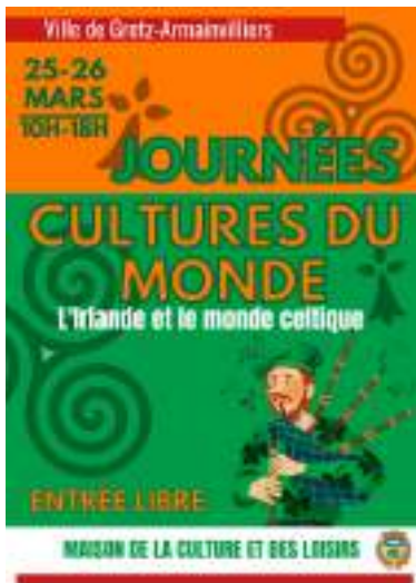
JOURNÉES CULTURES DU MONDE 25 et 26 Mars 2023 - de 10h00 à 18h00 à la Maison de la Culture et des Loisirs