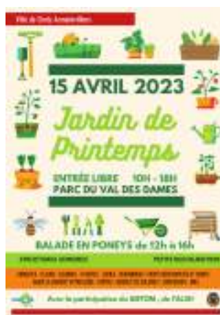
JARDINS DE PRINTEMPS 15 Avril 2023 - de 10h à 18h au Parc du Val des Dames