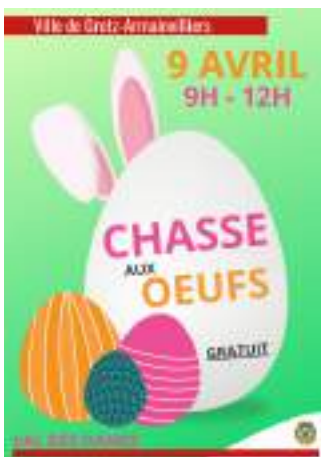
CHASSE AUX OEUFS 9 Avril 2023 - de 9h00 à 12h au Parc du Val des Dames