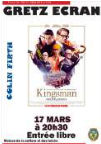
GRETZ ÉCRAN 17 Mars 2023 - à 20h30 à la Maison de la Culture et des Loisirs