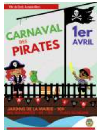
CARNAVAL 1er Avril 2023 - de 10h à 12h Départ à 10h de la Mairie Bal des Pirates de 11h à 12h, Place du Mesnil